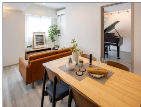
▲F タイプモデルルーム