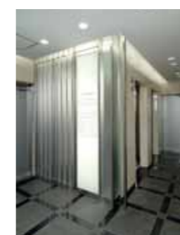
● EV HALL