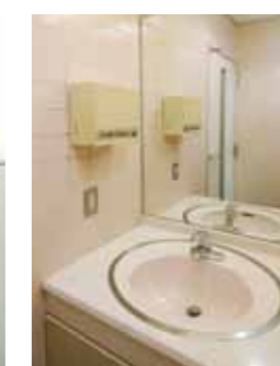
● POWDER ROOM