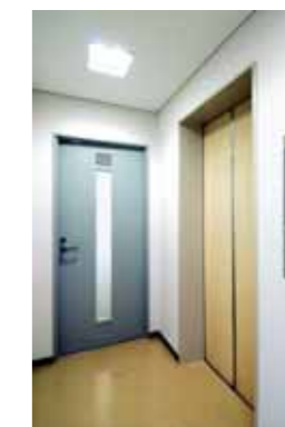
● 6F EV HALL