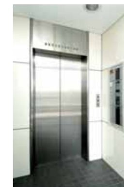
● 1F EV HALL