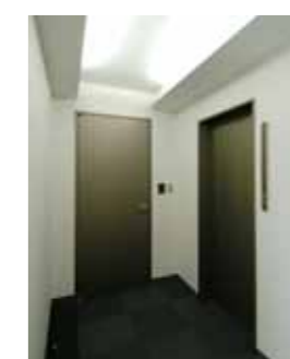
● EV HALL