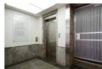
● 1F EV HALL