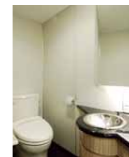
● POWDER ROOM