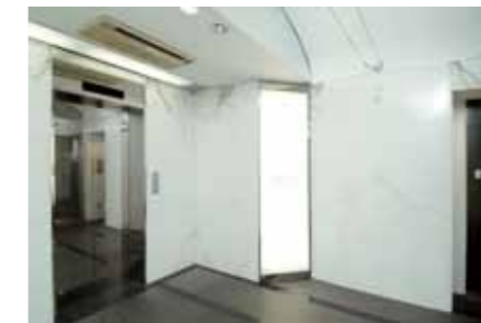
● 1F EV HALL